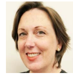
Yr Athro Sheila Rowan CBE, Llywydd y Sefydliad Ffiseg

“Rydym yn gwybod am y gwerth y mae amrywiaeth yn ei gynnig i ffiseg. Os yw cymdeithas am gael budd o'r gwerth hwn, rhaid i ni wneud mwy i greu amgylchedd croesawgar a chynhwysol i bawb. Gall y Sefydliad Ffiseg, a rhaid i'r Sefydliad Ffiseg, chwarae rôl arweiniol gan amlygu lleisiau a phrofiadau amrywiol sy'n gwneud cyfraniadau mor werthfawr i waith ein sefydliad ni ac i faes ffiseg. Mae'r uchelgais hwn yn ganolog i'n strategaeth bum mlynedd, a rhaid iddo barhau'n ganolog i bopeth a wnawn.”